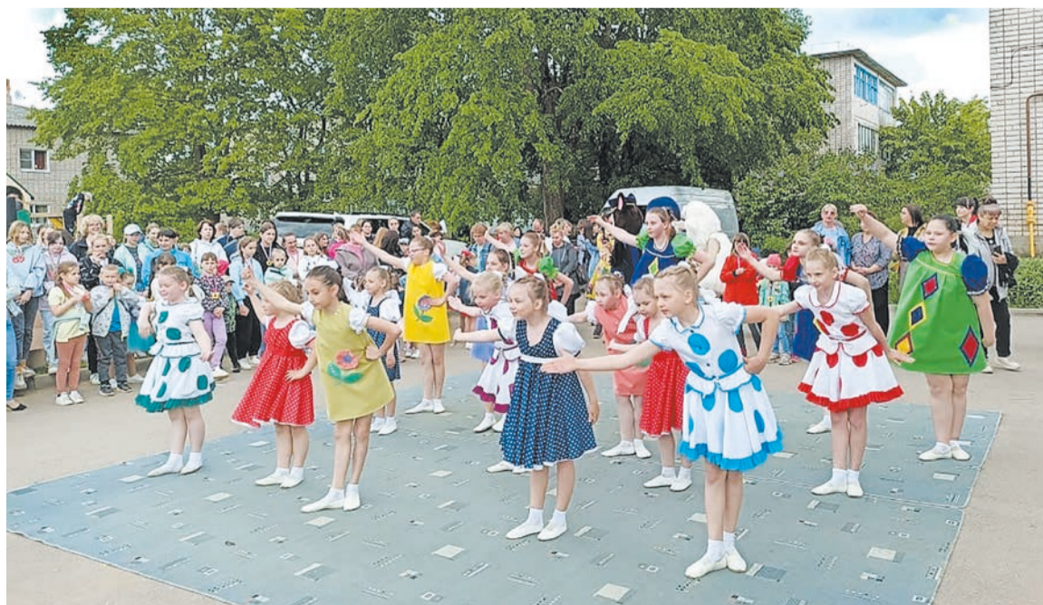
Выступает танцевальный коллектив «Мечта» культурно-спортивного комплекса «Сосновка»