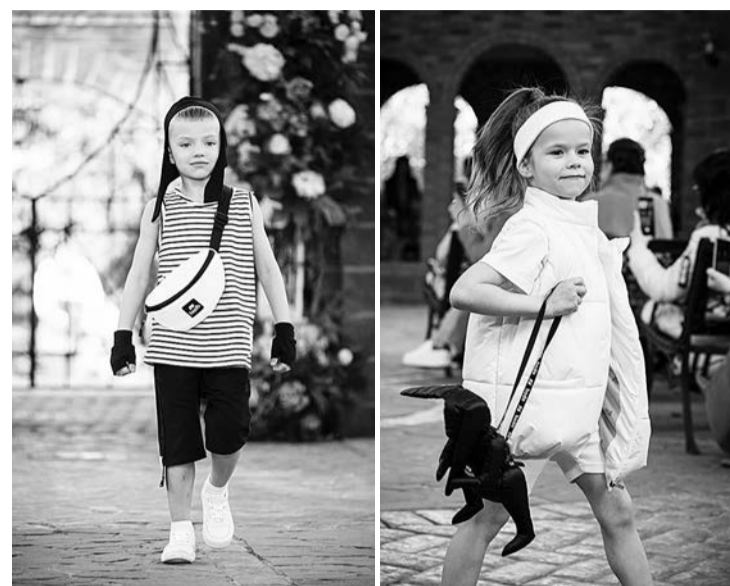
Показ стильной одежды «BODO» на церемонии вручения награды премии «Kids fashion awards» в Москве