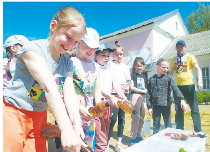
Профильный лагерь «Олимпиец» распахнул свои двери для любителей приключений!

– Тут главное – желание. Каждое лето, к примеру, молодёжь от 14 до 18 лет наводит чистоту на улицах нашего города и получают за это деньги. По информации Центра занятости населения, планируется трудоустроить в летний период 88 подростков.