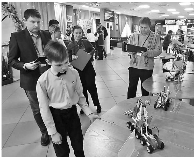
Жюри оценивает работу

Вы познакомитесь с робототехникой, программированием на компьютере, графическим дизайном и 3D-моделированием. Ребята усердно работают с квадрокоптерами, самолетами и дронами!