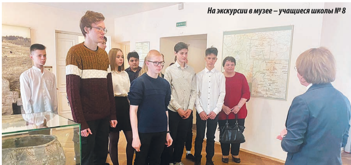
На экскурсии в музее – учащиеся школы № 8

Стоит отметить, что в проект уже включены более 1300 учреждений культуры в 85 регионах страны. Право стать обладателем «Пушкинской карты» есть у граждан России в возрасте от 14 до 22 лет. Оформить её в виртуальном виде или в пластиковом формате можно в мобильном приложении «Госуслуги.Культура». Репертуар, который участвует в программе, размещен на портале «Культура.РФ». Воспользоваться «Пушкинской картой» можно по всей России. Этот проект, действительно, открывает для молодежи двери в мир культуры и искусства и расширяет горизонты.