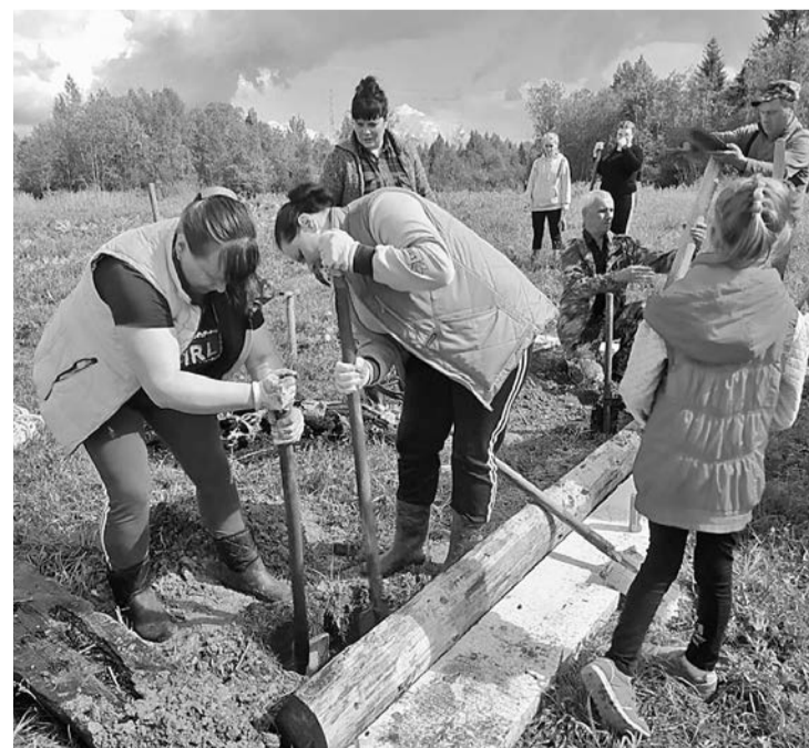
Порядок – общими усилиями

Теперь на берегу есть чистое, удобное место для отдыха на природе.